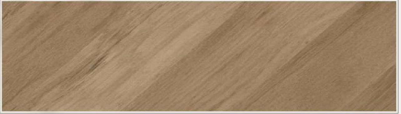
▫ RGT-9209 | 創意紅橡木