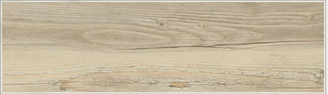
▫ RGT-9201 | 北歐白松木