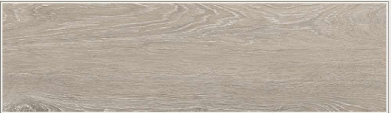
▫ RGT-9202 | 米白銀橡木