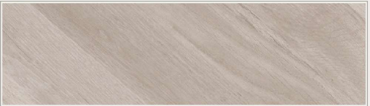
▫ RGT-9212 | 創意白橡木