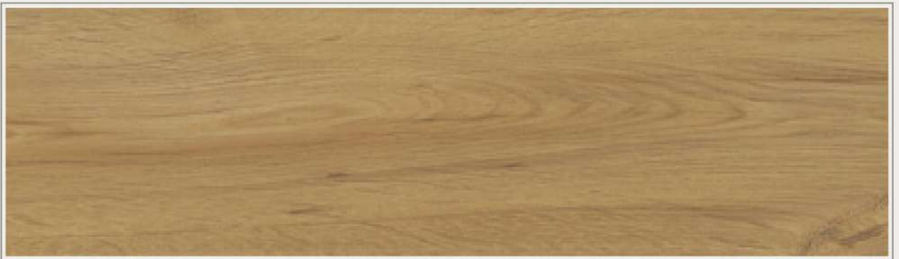
▫ RGT-9204 | 典藏黃橡木