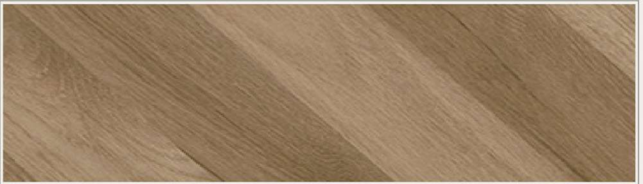
▫ RGT-9210 | 創意紅橡木