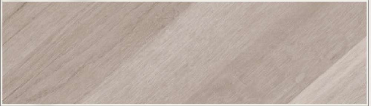
▫ RGT-9211 | 創意白橡木