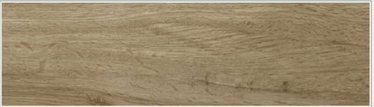
▫ RGT-9203 | 北美暖橡木